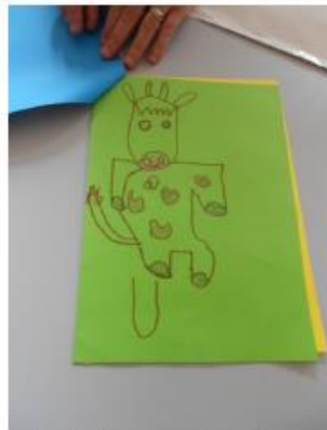
Dessin d'un « grande section »