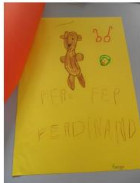
Dessin d'une « moyenne section »