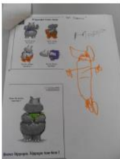
Dessin d'une « petite section »